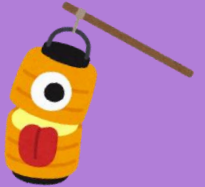
かくれんぼおばけ