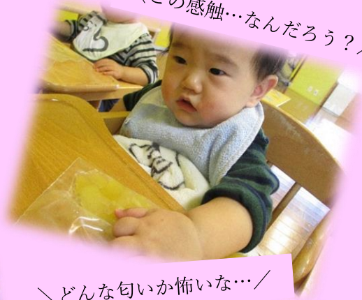
どんな匂いか怖いな