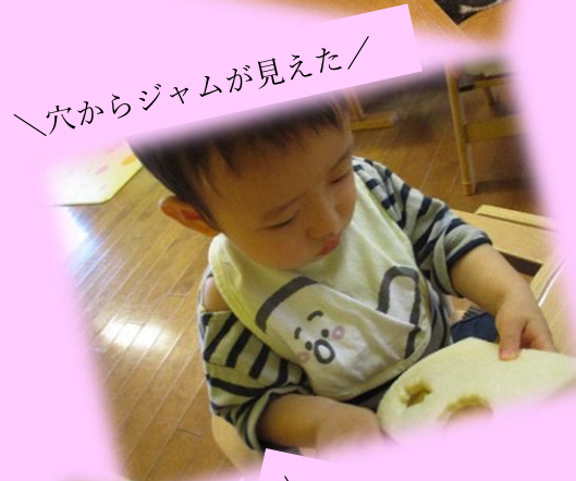
穴からジャムが見えた!