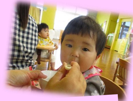
パン粥にジャムのってた!