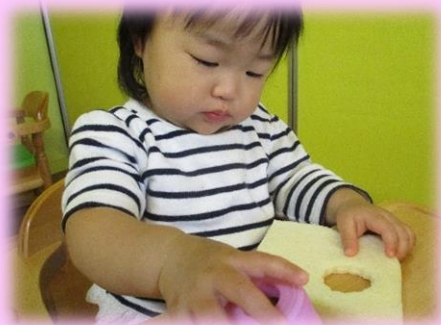
この感触...なんだろう?