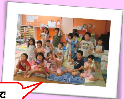
手作りランチで おやすみなさ〜い