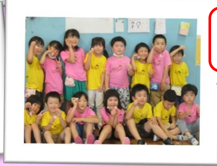
謎解きゲームで お宝ゲット!